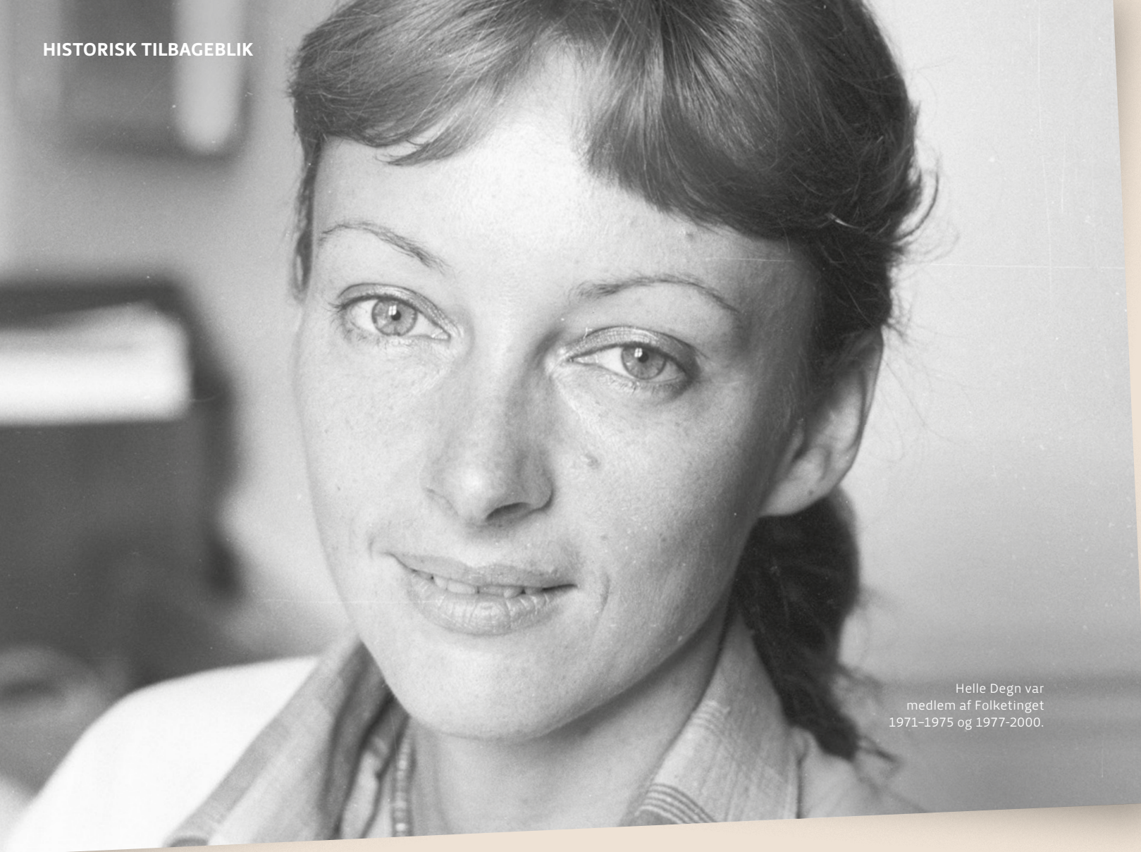
Helle Degn var medlem af Folketinget 1971-1975 og 1977-2000.