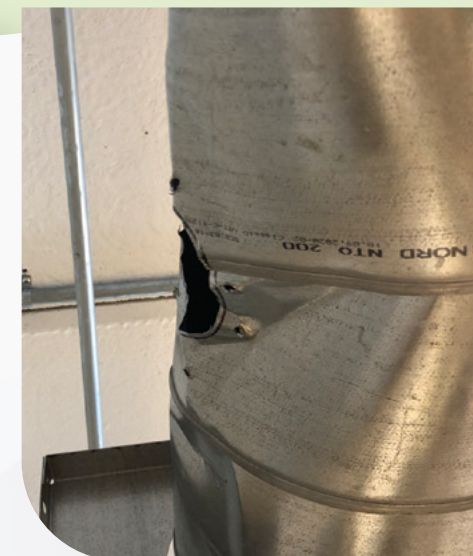
Billede fra en erhvervsskole: Her ses et ventilationsrør, som har været brugt, så det er blevet bulet, og der er kommet huller i, efter det tidligere er blevet monteret med skruer.

Der er brug for at investere massivt i erhvervsuddannelserne. Det er en bunden opgave for en socialdemokratisk ledet regering!