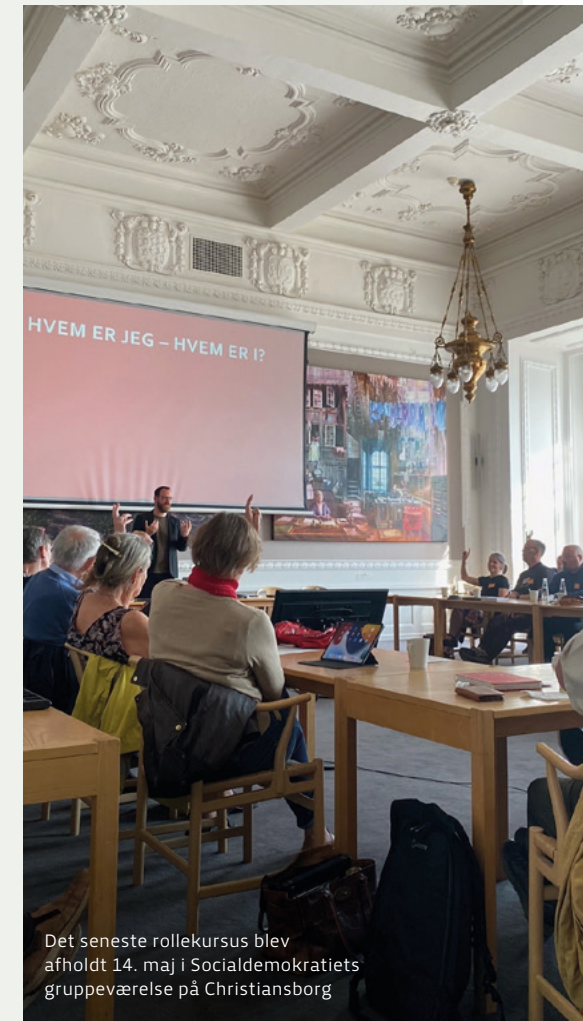
Det seneste rollekursus blev afholdt 14. maj i Socialdemokratiets gruppeværelse på Christiansborg

Uanset om I ønsker et enkelt fagspecifikt oplæg til et medlems- eller bestyrelsesmøde, eller om I ønsker et længere forløb, hvor der fokuseres på det organisatoriske arbejde i lokalforeningen, så skal I booke en underviser gennem jeres lokale uddannelseskoordinator. Kontakt dem og hør mere om, hvilke kurser vi udbyder. 🌟