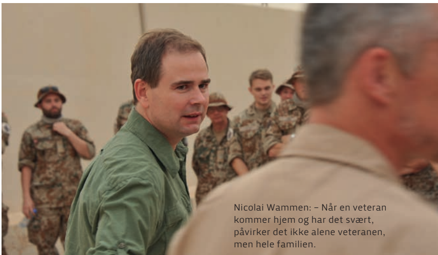
Nicolai Wammen: – Når en veteran kommer hjem og har det svært, påvirker det ikke alene veteranen, men hele familien.

Sommerlejre for veteraner med børn. Det er blot en af de aktiviteter i den danske veteranindsats, der vil blive styrket, som følge af de aftaler regeringen har fået på plads. Gennem to forlig er der afsat 55 millioner kroner til arbejdet. Her er de pårørende i højere grad end tidligere tænkt ind som en del af indsatsen, og ifølge Nicolai Wammen er det ikke tilfældigt.