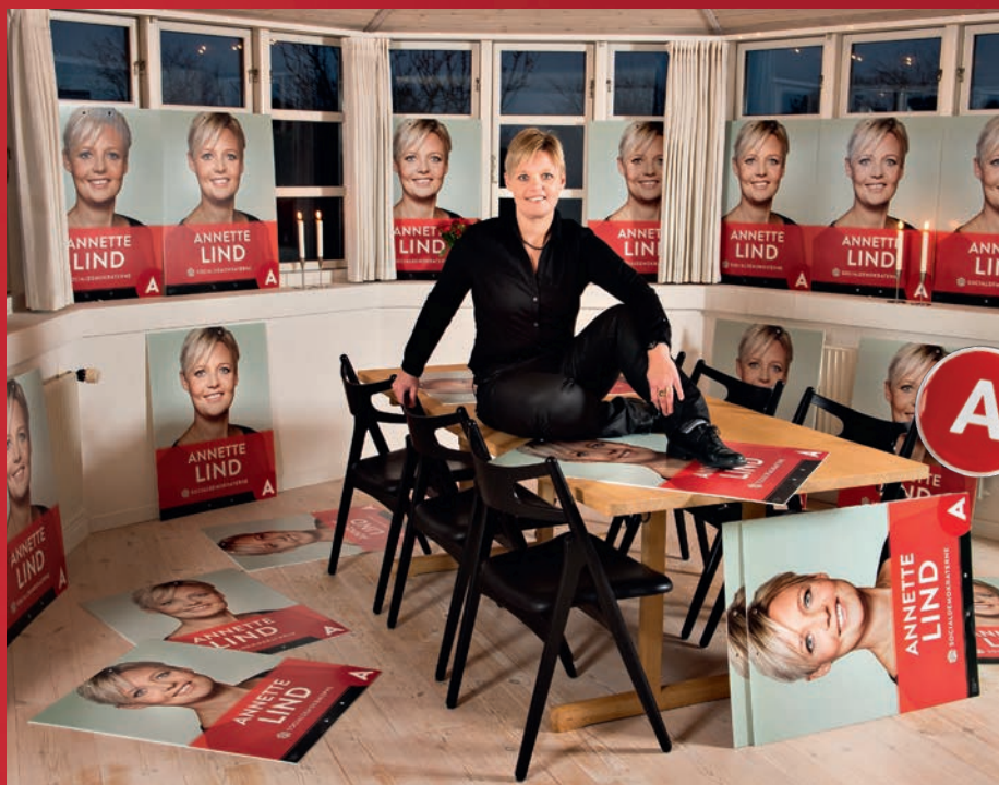
Annette Lind, 45 år, medlem af Folketinget siden 2011, er blandt andet uddannelsesordfører.

– Folk kom ind fra gaden og hilste på, patienter fra det nærliggende sygehus kom et smut forbi, unge, gamle, studerende og indvandrere. Alle mulige typer af mennesker kom ind til en kop kaffe og en snak. Det var enormt givende for os og meget motiverende for vælgerne, fortæller hun.