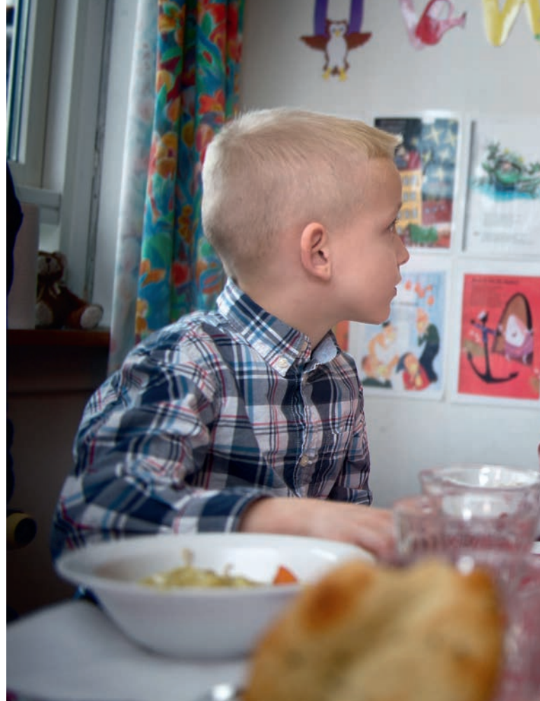
Seksårige Theis var ikke så vild med agurkestænger. Til gengæld kunne han godt lide statsminister Helle Thorning-Schmidt.

– Det er positivt, når man midt i tider, der er vanskelige, får mulighed for at afsætte en milliard over fire år til institutioner-