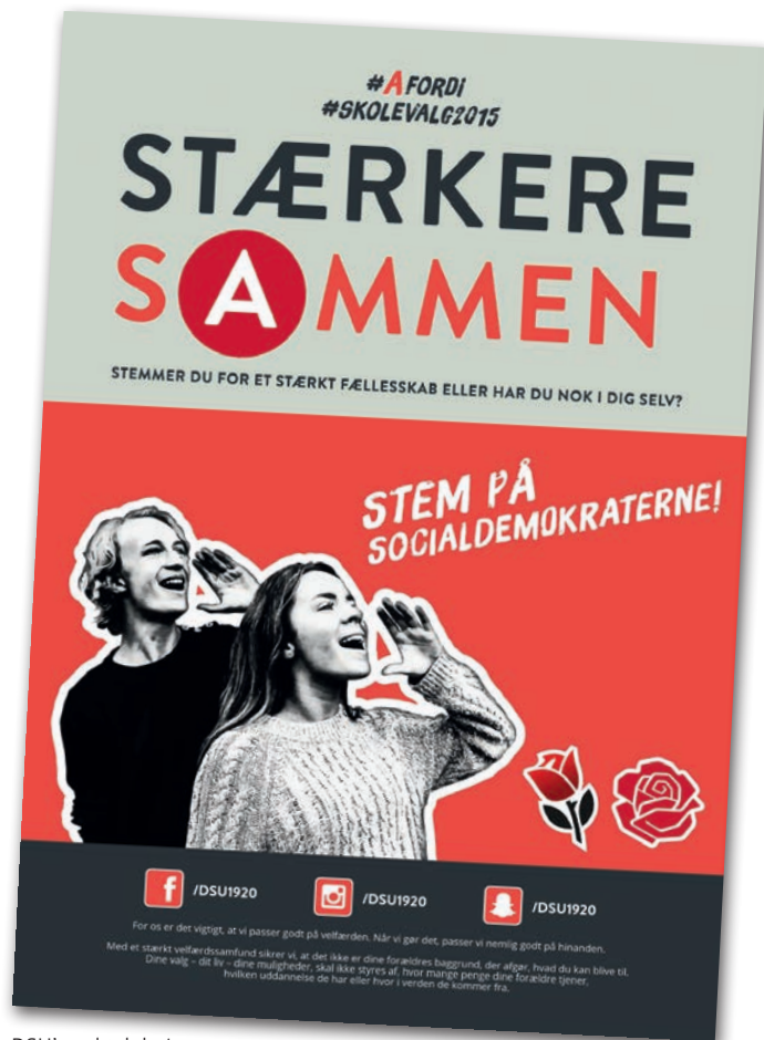
DSU's valgplakat til Skolevalg 2015.

Du kan blive (støtte)medlem på: www.dsu.net/medlemskab/meld-dig-ind