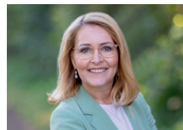
Christel Schaldemose Gruppeformand for de danske socialdemokrater i Europa- Parlamentet