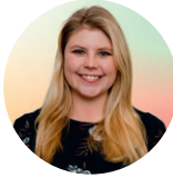
AF KATRINE EVELYN JENSEN, FORBUNDSFORMAND, DSU